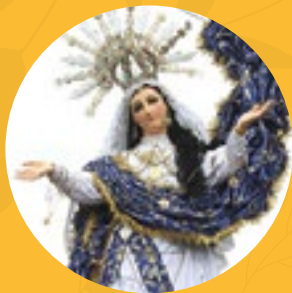
Nuestra Señora de la Asunción