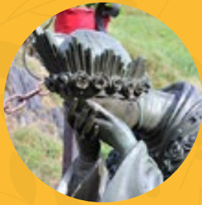
Nuestra Señora de La Salette