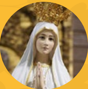
Nuestra Señora de Fátima