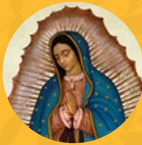
Nuestra Señora de Guadalupe