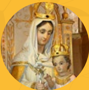
Nuestra Señora de La Paz