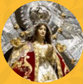
Nuestra Señora de Los Ángeles