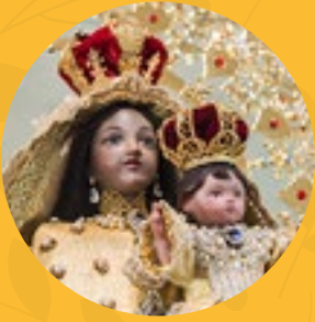
Nuestra Señora de la Caridad del Cobre