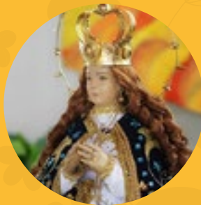
Nuestra Señora de Caacupé