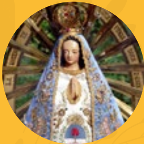
Nuestra Señora de Luján

“María anda por nuestros poblados, calles, plazas... Es la Virgen de la Tirana; la Virgen Ayquina en Calama; la Virgen de las Peñas en Arica”, dijo el papa Francisco en su visita a Chile (Iquique, 18 de enero 2018). A continuación presentamos a algunas Patronas o devociones de nuestros países vecinos.