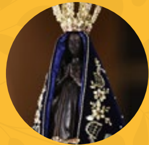
Nuestra Señora de Aparecida