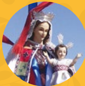
Nuestra Señora del Carmen