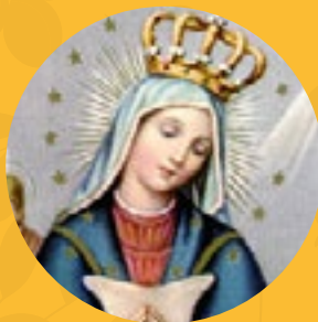
Nuestra Señora de Altagracia