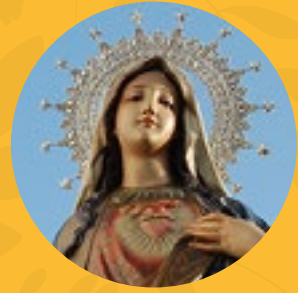
Nuestra Señora del Inmaculado Corazón de María