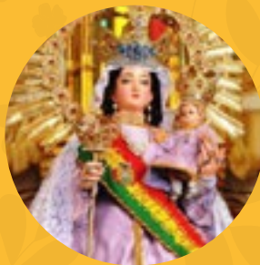
Nuestra Señora de Copacabana