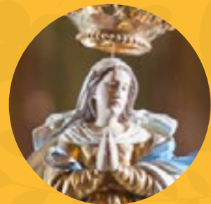
Nuestra Señora de los Treinta y Tres