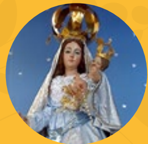
Nuestra Señora del Rosario