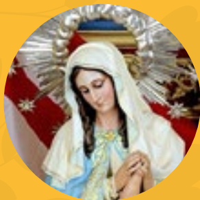
Nuestra Señora de la Providencia