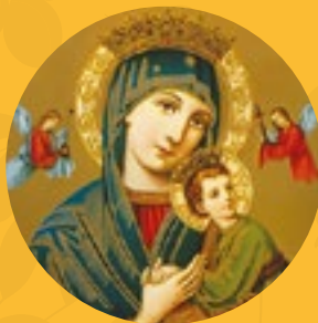
Nuestra Señora del Perpetuo Socorro