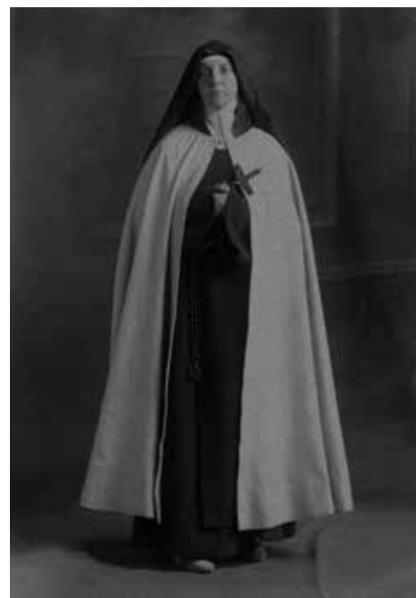
Primera foto como carmelita.

Lee esta carta completa haciendo clic aquí ➤